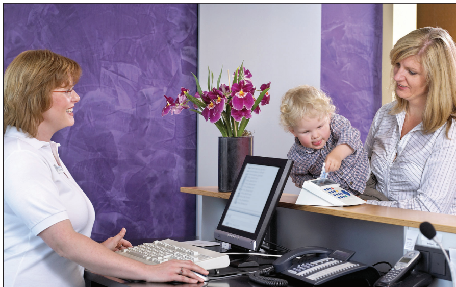
Abbildung 1: Schlüssel zum Erfolg – Chipkarten im Gesundheitswesen

Leistungserbringer wie Ärzte, Apotheker oder weitere Heilberufler haben beispielsweise die Möglichkeit, eine vorgelegte Karte auf Gültigkeit zu überprüfen. Hierzu wird eine online Anfrage an das entsprechende CMS geleitet. Anhand der übermittelten Seriennummer überprüft das CMS den Status der Chipkarte und schickt diesen zurück. Ungültige Karten, die bereits abgelaufen sind, gestohlene oder verloren gegangenen Karten können so dem Leistungserbringer transparent gemacht werden. Auf diese Art und Weise hilft das CMS, den Missbrauch von Leistungen innerhalb der Krankenversicherung zu verringern.