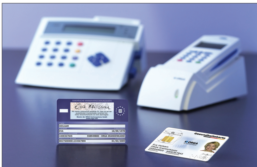
Abbildung 4: Chipkarten-Technologie für effizientere Versorgung im Gesundheitswesen