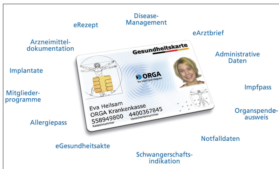
Abbildung 3: Attraktive Zusatzanwendungen über CAMS verwalten

Sowohl die Pflicht- als auch die freiwilligen Anwendungen unterliegen einem Lebenszyklus, der sich auf Beginn und Ende einer Anwendung bezieht. Der aktuelle Status sowie die Historie der Karte sind während der gesamten Lebensdauer im CAMS verfügbar. Das CAMS übernimmt auch eine Schlüsselfunktion beim Nachladen oder Aktualisieren einer neuen Anwendung im Feld. Mikroprozessorkarten sind mit einem eigenen Betriebssystem ausgestattet, das es ermöglicht, zusätzliche Anwendungen in den Chip der Karte einzubringen. Diese nachgeladenen Anwendungen bestehen in erster Linie aus Dateistrukturen, die durch ein Kommando in den nicht flüchtigen Speicher der Karte gespeichert werden. In diesem Filesystem werden dann zukünftig die zur Anwendung gehörenden Daten oder Verweise auf abgelegte Daten im Hintergrundsystem, gespeichert. Das CAMS muss alle zum Einsatz kommenden Chipkarten-Betriebssysteme in ihrer neuesten Version sowie die dazugehörigen Kommandosätze für das Nachladen von Anwendungen unterstützen.